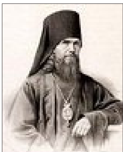
Святитель Феофан Затворник